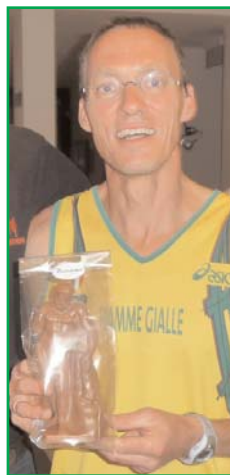
→ Ein Schoko-Herkules für den Berglauf-Sieger:

„Es war ein toller Lauf und ein tolles Wochenende für mich in Kassel“, freute sich Baumann. Denn abends zuvor hatte er mit seinem Kabarett „Körner, Currywurst, Kenia“ im ausverkauften Starclub bereits viel Spaß, nach dem Berglauf folgte am Samstag noch ein weiteres Gastspiel im Haus der Kirche. Vielleicht war es aber auch die Startlinie des Berglaufs an der Schulstraße, die ihn doch sehr „an den Crosslauf in Nyahuru in Kenia“ erinnerte und